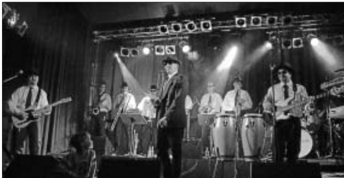
Midnight Hour - volle Bühnenpräsenz

Midnight Hour - eine Band aus dem Raum Stuttgart, die seit ca. 20 Jahren nicht mehr aus der Musikszene weg zu denken ist. Die Band hat über die Jahre unzählige Hallen, Festzelte und Open Airs gefüllt und überall ein begeistertes Publikum hinterlassen. Auch zusammen mit nationalen und internationalen Größen wie z.B. Maria Glenn und Michael Mittermeier. Sogar dem VfB Stuttgart heizte Midnight Hour schon in der Mercedes-Benz-Arena ein.