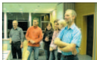
Entspannte Atmosphäre bei den SCHLAEGERMUSIKERN zu Beginn der probenreichen Endphase des Projekts

Lassen Sie sich überraschen von Remsecker Bürgern, die ihren Sport, ihre Freizeit und ihre Arbeitswelt zum Klingen bringen, von zwei kanadischen Künstlerinnen, die Ihnen eine ganz andere Sicht auf Remseck präsentieren werden und auf eine Weltpremiere in Remseck. Auf SCHLAEGERMUSIK.