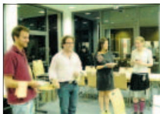
Künstler, Projektleiter und Dramaturg bei der Präsentation der Pasta